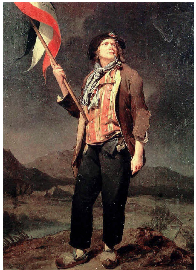
Sans-Culotte , obra de Louis Leopold-Bouilly. Con la escarapela o cinta tricolor (blanca, roja y azul) fue el símbolo de la unidad y el poder de la Guardia Nacional francesa.